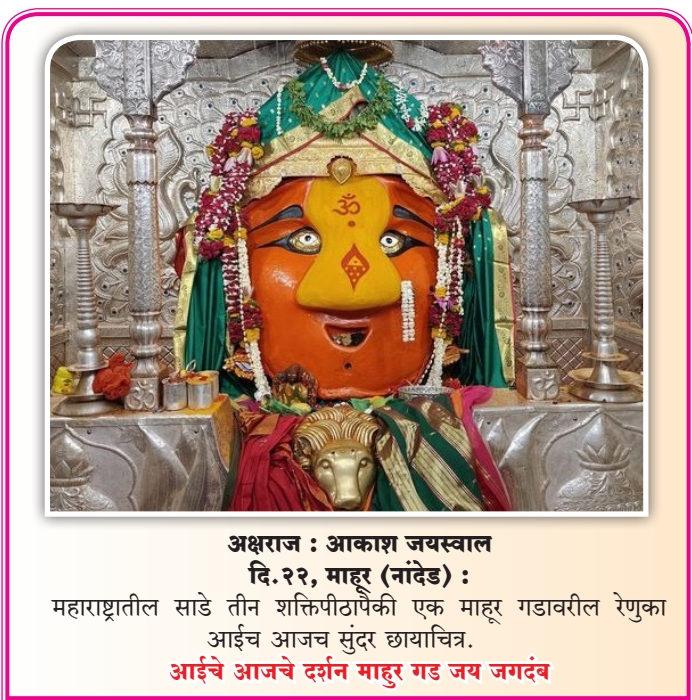
अक्षराज : आकाश जयस्वाल दि. २२, माहूर (नांदेड) : महाराष्ट्रातील साडे तीन शक्तिपीठांपैकी एक माहूर गडावरील रेणुका आईचे आजच सुंदर छायाचित्र. आईचे आजचे दर्शन माहूर गड जय जगदंब